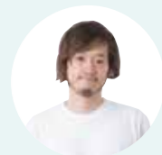
ファッションバイヤー/ ファッションプロガー MB氏

年間1000着以上の洋服に袖を通し、「おしゃれはセンスではなくロジック」と語る人気バイヤー