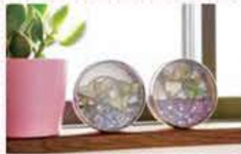
造花やきれいな色の砂を入れればグリーンイン テリアに変身！ 重りになるので立てかけOK