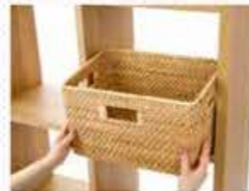
ボックスがマスにぴったりフィット! ごちゃつく ゲーム類やコードなどを隠して収納できる