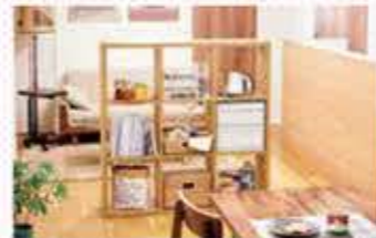
リビングとダイニングを仕切るパーテーションに もなるし、両側から取り出せて一石二鳥!