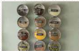
お弁当ピックやスパイスなど使用頻度が高い小物 を入れるのにベスト！ 探す手間カットで時短に