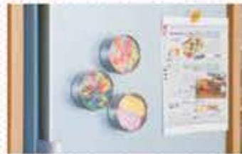
裏面には強力なマグネットが付いているので、食 材を入れて重みで落ちてしまう心配も必要ナシ