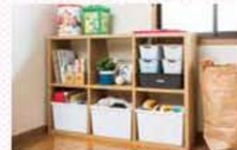
扉がないので片付けやすい! 収納ボックスと組 み合わせればごちゃつきを隠せてスッキリ