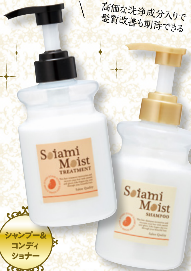
シャンプー& コンディショナー