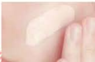
効果のあるビタミンC美容液使用前と1カ月使用後の頬を専門機器で撮影