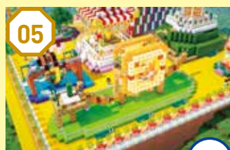
05 ループコースター