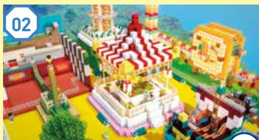
02 メリーゴーラウンド