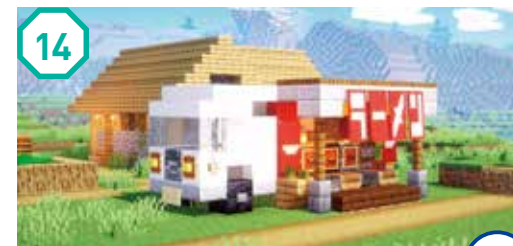
14 ラーメンキッチンカー