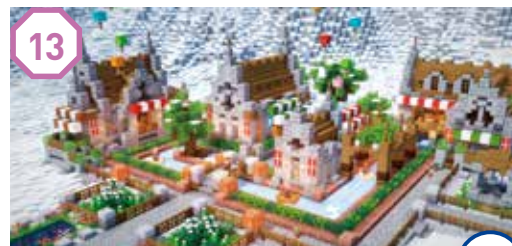
13 アイスポートサーキット