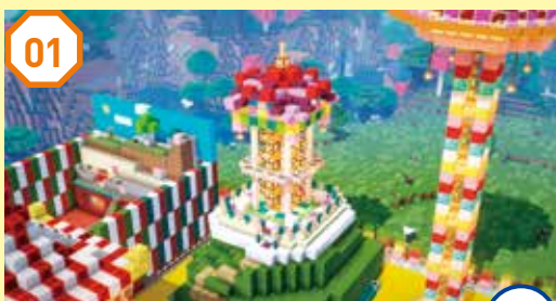
01 フリーフォールタワー